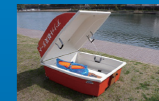
保管庫として防災用品をたっぷり収納。