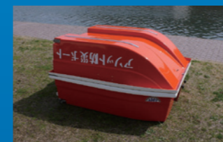
折りたためば、よりコンパクト・省スペースに。