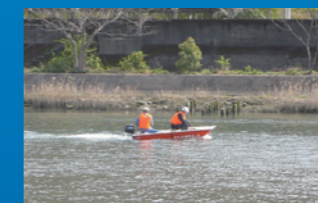
船外機を取付ければ、さらに速やかに安全避難。