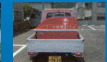
軽トラに納まり移動も簡単、機動力を発揮。