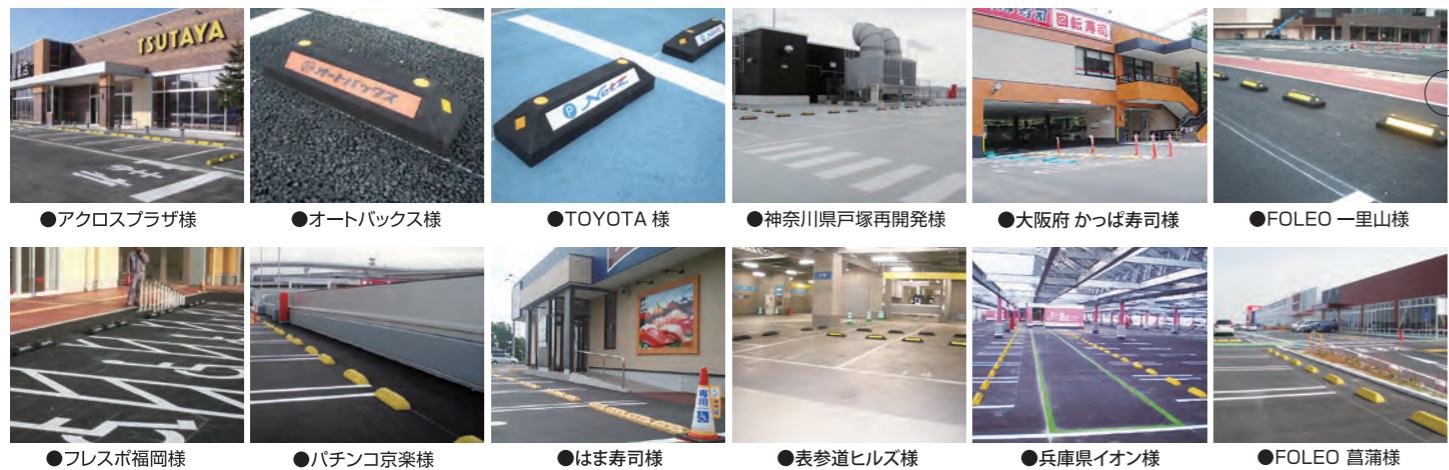
●アクロスプラザ様 ●オートボックス様 ●TOYOTA 様 ●神奈川県戸塚再開発様 ●大阪府 かつば寿司様 ●FOLEO 一里山様 ●フレスポ福岡様 ●パチンコ京楽様 ●はま寿司様 ●表参道ヒルズ様 ●兵庫県イオン様 ●FOLEO 菖蒲様