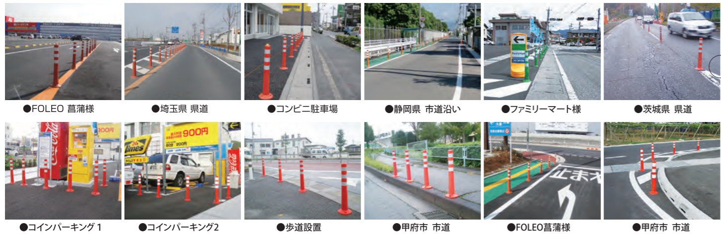
●FOLEO 菖蒲様 ●埼玉県 県道 ●コンビニ駐車場 ●静岡県 市道沿い ●ファミリーマート様 ●茨城県 県道 ●コインパーキング1 ●コインパーキング2 ●歩道設置 ●甲府市 市道 ●FOLEO菖蒲様 ●甲府市 市道