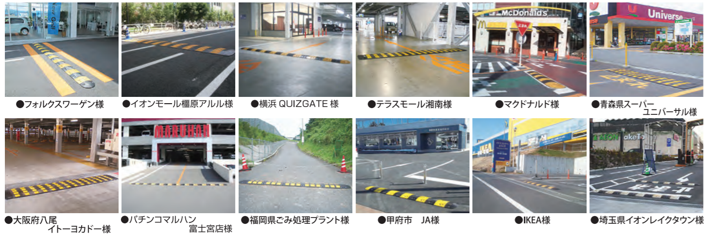
●フォルクスワーゲン様 ●イオンモール榎原アルル様 ●横浜 QUIZGATE 様 ●テラスモール湘南様 ●マクドナルド様 ●青森県スーパーユニバーサル様 ●大阪府八尾イトーヨーカドー様 ●パチンコマルハン 富士宮店様 ●福岡県ごみ処理プラント様 ●甲府市 JA様 ●IKEA様 ●埼玉県イオンレイクタウン様