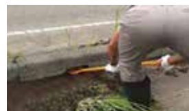
除草ショベル(小)は水抜き穴にも対応。

全長:1,100mm 本体(頭): 幅:165mm 高さ:215mm 重さ:約1.4Kg