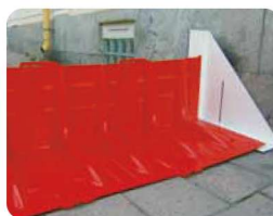
▲サイドアタッチメント