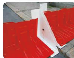
▲段差対応アタッチメント