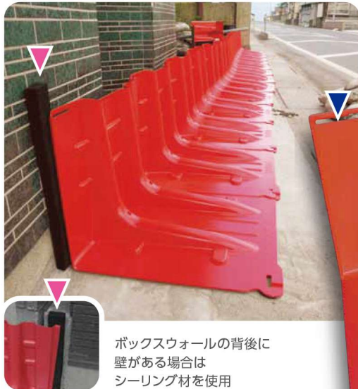
ボックスウォールの背後に壁がある場合はシーリング材を使用