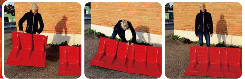
▲設置は、ボックスウォールを背後から見て左から右に並べる

Boxwallは特殊な工具やスキルを必要とせずに設置ができ、ユニットのジョイント部(▼印)をつなぐことができます。各ジョイント部は±3度の調節ができ、カーブした設置場所でも対応可能です。