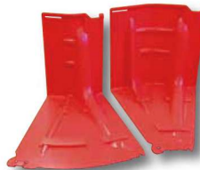
アウトコーナー(左)インコーナー(右)▶