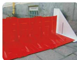
▲サイドアタッチメント