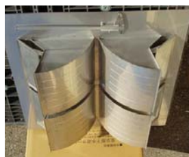
【排水部4個】 F市：交差点内