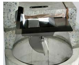
縁塊ブロックずれ対応 特注型平可動タイプ