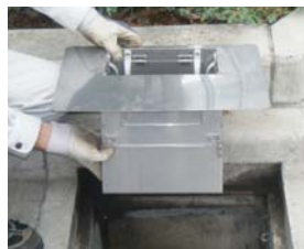
【エアー抜き付】 H市：中心市街地